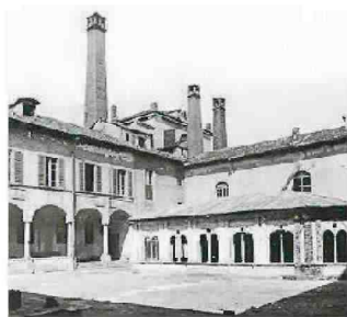
L'antico ospedale San Matteo